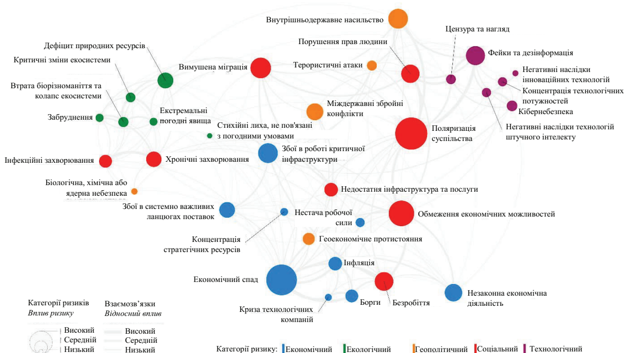
Рис. 1. Глобальний ландшафт ризиків: карта взаємозв'язків 17

Розроблення й ухвалення геостратегічних рішень щодо формування конкурентоспроможності держави в глобальному просторі базуються на результатах стратегічного аналізу глобальних трендів і з урахуванням напрацювань «експертної дипломатії». Інформаційною базою для аналізу глобальних викликів і трендів можуть слугувати аналітичні дані Звіту про глобальні ризики у 2024 році Всесвітнього економічного форуму ( The Global Risks Report 2024 ) 16 , у якому систематизовано основні виклики глобальному розвитку в діапазоні найближчих 10 років (рис. 1).